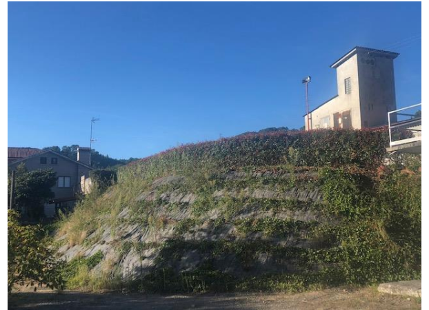
Fig.10 y 11. Entorno de las oficinas de MIBASA