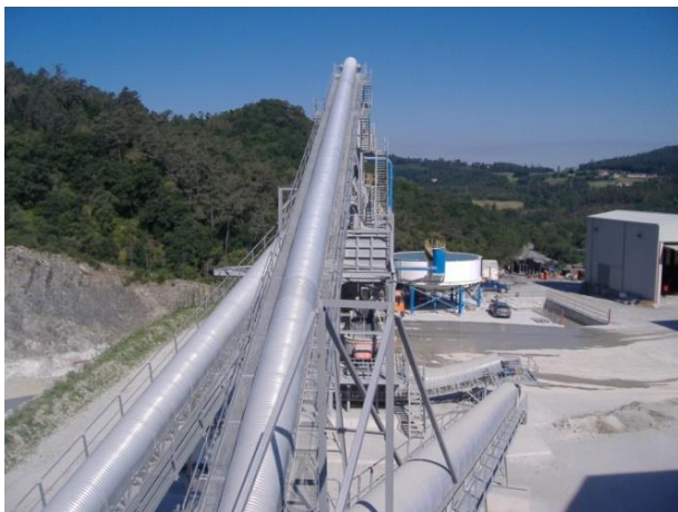
Fig 3. Vista general de las cintas de alimentación al triturados de eje vertical con capotaje integral

En el caso de las emisiones derivadas de las situaciones de emergencia se llevan a cabo los correspondientes mantenimientos preventivos de nuestros equipos y dispositivos de prevención, eliminando de forma significativa la probabilidad de ocurrencia y el impacto asociado.