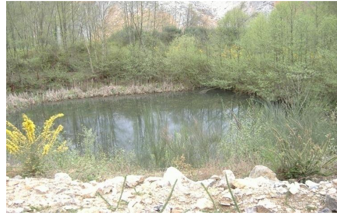
Fig. 9. Balsas de decantación de recogida de aguas pluviales y escorrentía.