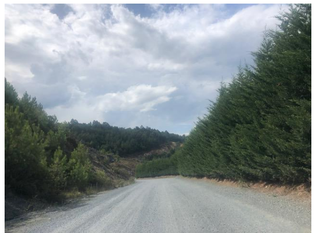
Fig.12 y 13. Detalle de la revegetación con pinos de taludes de la explotación y anexos a la planta de machaqueo