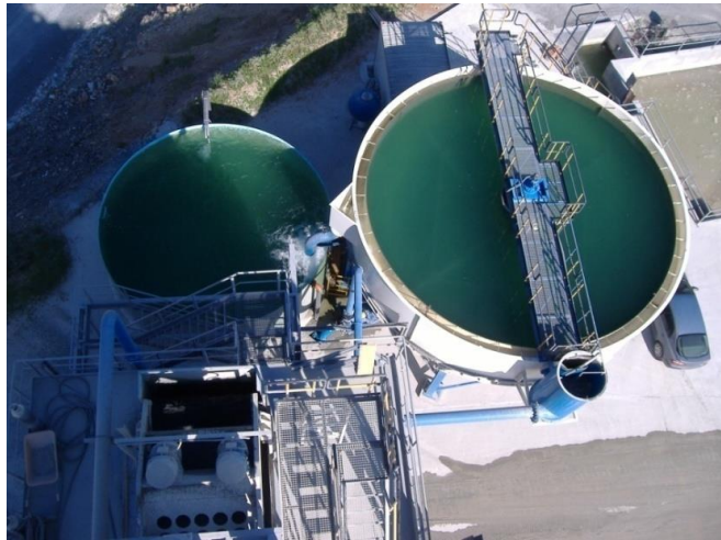
Fig 5. Detalle planta lavado de arena y depuración de agua