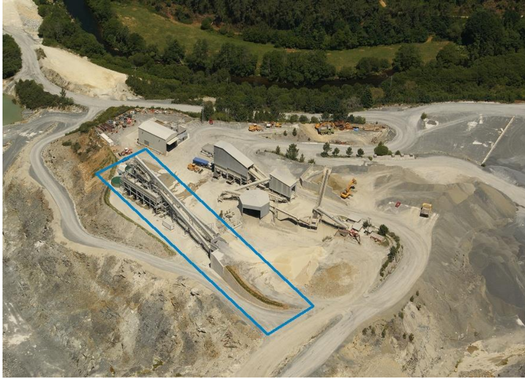
Vista general de la Planta de Monte Carreira, en donde se señala la ampliación

Indicar que el alcance de la presente declaración es exponer los resultados del desempeño ambiental derivados del proceso productivo de la Planta de Monte Carreira, siendo ampliada la planta de lavado en el segundo semestre de 2011, incorporando una nueva sección de machaqueo y molienda, así como y el proceso de lavado de arena y depuración de agua ( conforme fotografía adjunta ), que anteriormente se realizaba en la Planta de Bascuas, que fue desmantelada totalmente en el mes de mayo de 2013.