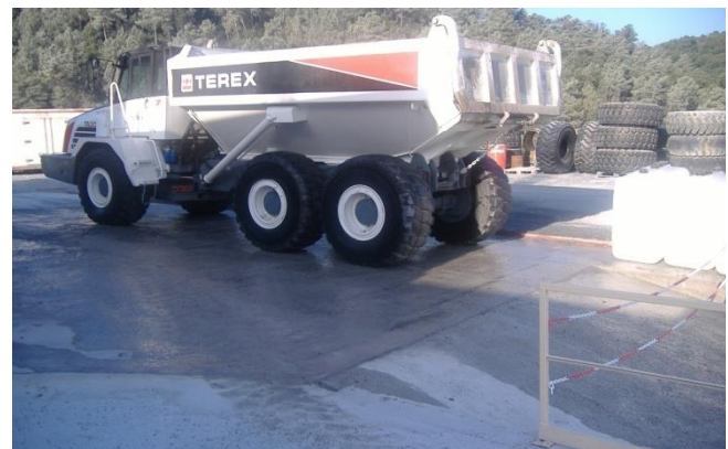
Fig. 6 y 7. Zona de lavado de maquinaria móvil con sistema de recogida y depuración de aguas residuales