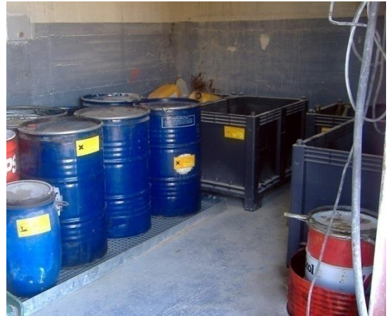
Fig 1 y 2. Almacenamiento de Residuos peligrosos y no peligrosos en el taller de Monte Carreira

El responsable de medio ambiente conserva los documentos de entrega de todos los residuos a gestor autorizado. Por otra parte dispone y registra cada entrega tanto de residuos no peligrosos, como peligrosos en el correspondiente libro, en base a los requerimientos legales vigentes.