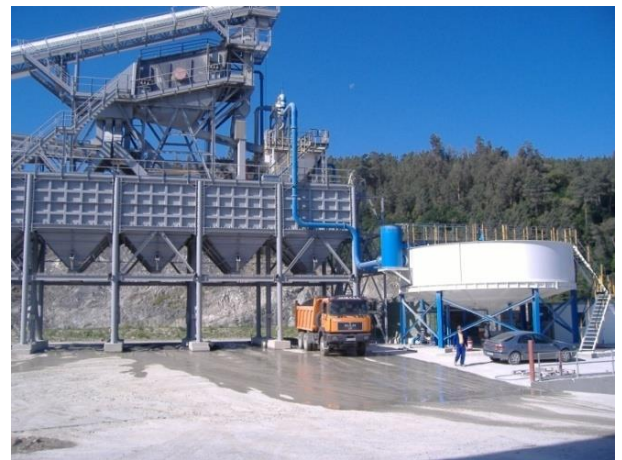
Fig 4. Vista general de la criba y tolvas de la planta de machaqueo y de la planta lavado