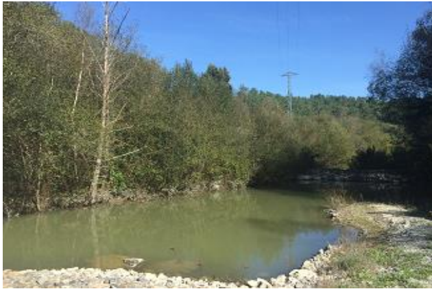
Fig. 8. Balsas de decantación de recogida de aguas pluviales y escorrentía de la que se extrae el agua de riego